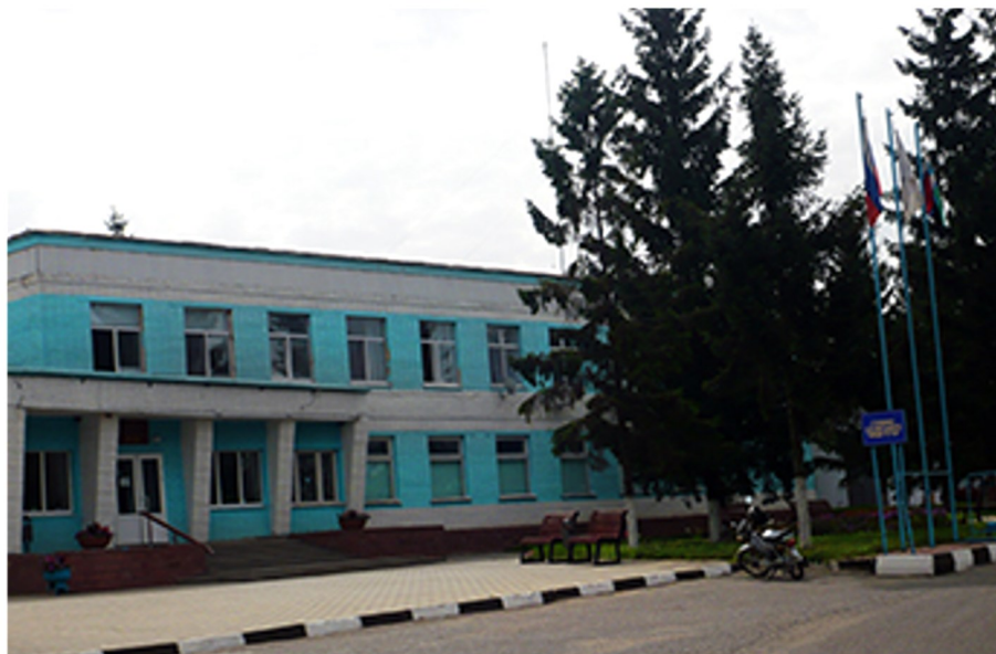
Офисное здание ЗАО «Агрофирма «Русь», 2007 год