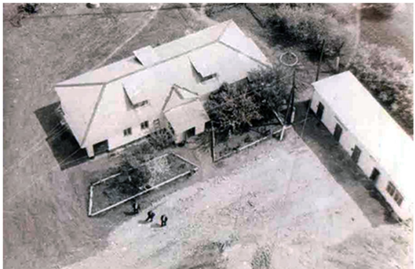
Контора Корочанского РЭС 1959 г.