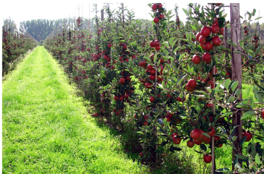
ЗАО «Корочанский плодопитомник»

Направления деятельности: садоводство, производство плодов яблок, груш, вишни, черешни, алычи, сливы, ягод земляники садовой и малины; производство посадочного материала плодово-ягодных культур (саженцы яблони, груши, вишни, черешни, алычи и т.д.), рассада земляники, малины, смородины.