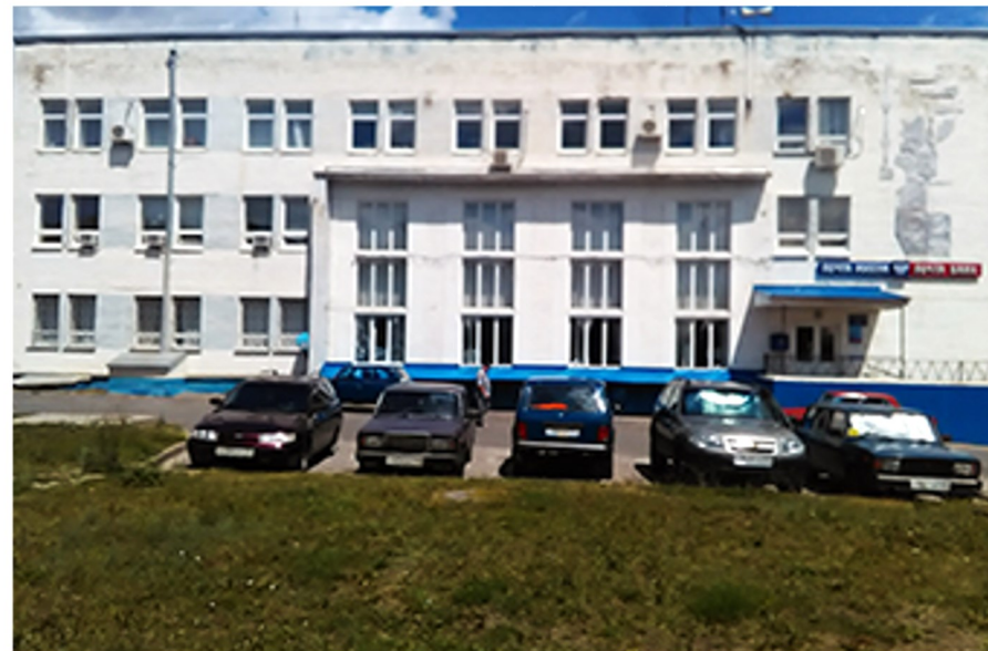
Новое здание почты