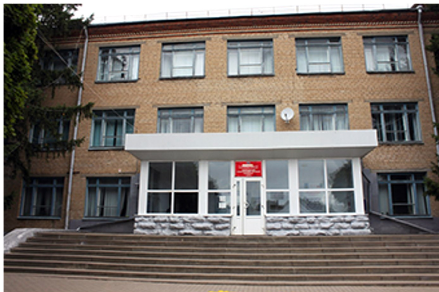
Корочанский сельскохозяйственный техникум

В соответствии с приказом Министерства сельского хозяйства Российской Федерации от 8 января 1992 г. № 12, приказом Госагропрома РСФСР от 20 января 1992 г. № 5 был реорганизован в Корочанский сельскохозяйственный техникум с учебно-производственным хозяйством.