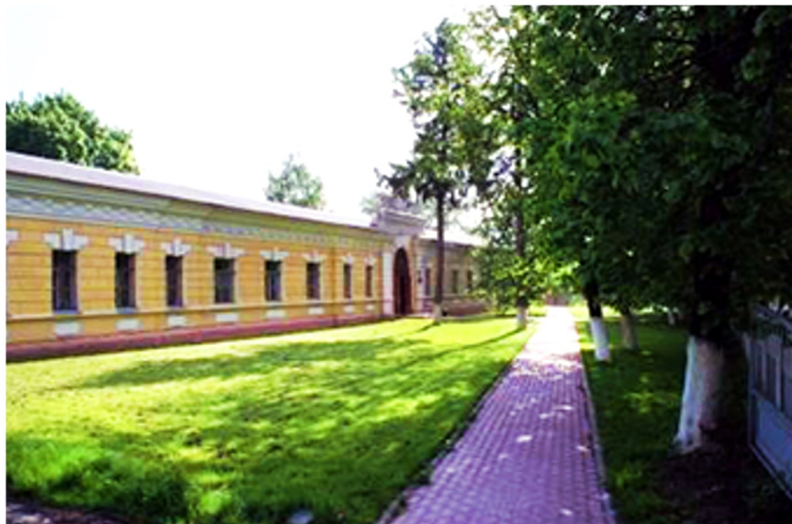
Административное здание ОГБУЗ «Корочанская центральная районная больница»

Доброй традицией стало проводить общественные мероприятия, посвященные Дню медицинского работника, Дню медицинской сестры, Дню Победы, участие в общественных спортивных мероприятиях района, благоустройства территории. С целью пропаганды здорового образа жизни организуются «Поезда здоровья» на селе.