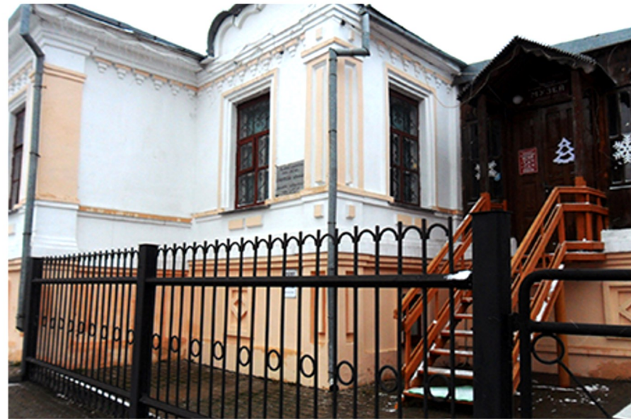
Здание МКУК «Корочанский районный историко-краеведческий музей»