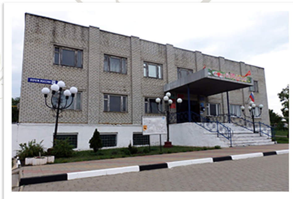
Административное здание «ООО «РусАгро-Инвест» ПО № 2 «Истобнянское»

11 марта 1999 года акционерное общество закрытого типа (АОЗТ) «Большехаланское» реорганизовано путем присоединения его к Открытому акционерному обществу «Машинотехнологическая станция-Агропромышленный комбинат «Яблоновский» (ОАО МТС АПК «Яблоновский»).