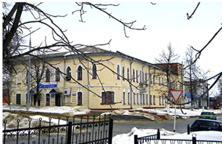
Здание ООО «Белогорье» и К (наше время)

Основным конкурентным преимуществом предприятия являются: БЕЗУСЛОВНО ВЫСОКОЕ КАЧЕСТВО ПРОДУКЦИИ!