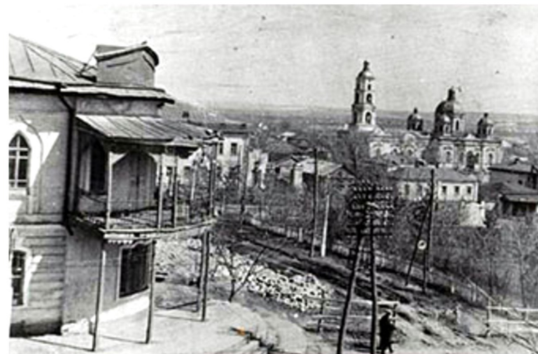
Здание ООО «Белогорье» и К