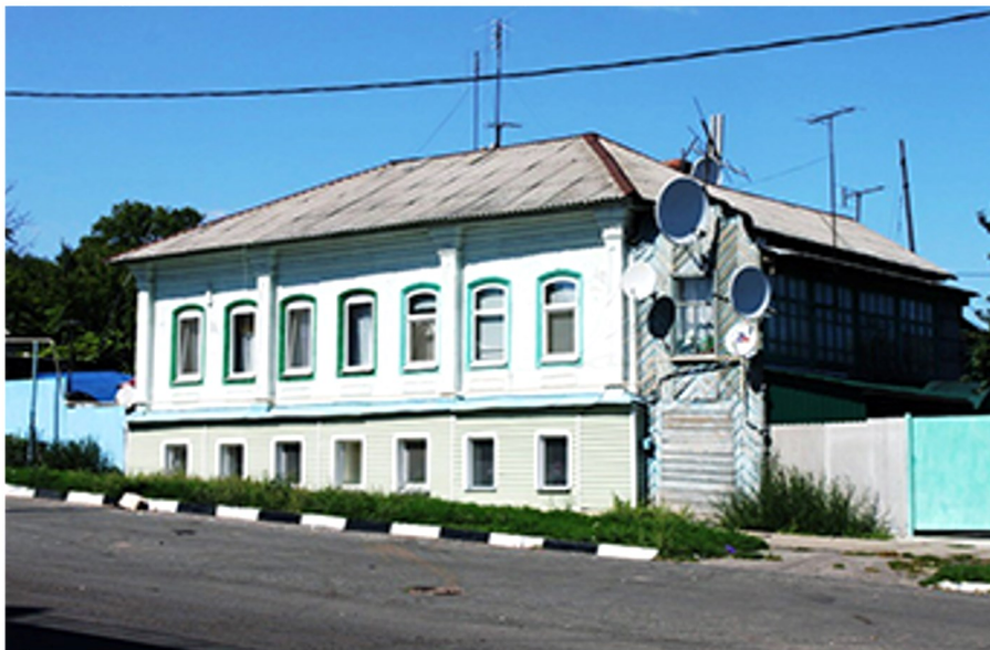
Старое здание почты

Участие почты России в федеральной целевой программе (ФЦП) правительства Российской Федерации «Электронная Россия 2002 – 2010 г.г.» должно значительно улучшить качество предоставляемых услуг, а также значительно повысить возможности федеральной почты по продвижению информационных услуг населению и значительному расширению их номенклатуры. Неотъемлемой частью ФЦП «Электронная Россия» является экспресс - доставка «EMS Почта России». В настоящее время почта России внедрила новый вид услуги «Отправления 1 – го класс» - это письма и бандероли со сроками доставки менее чем у универсальных услуг и тарифами, доступными всем слоям населения.