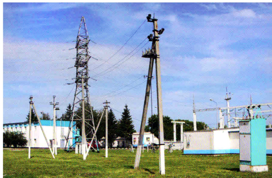
Территория Корочанского РЭС, наши дни