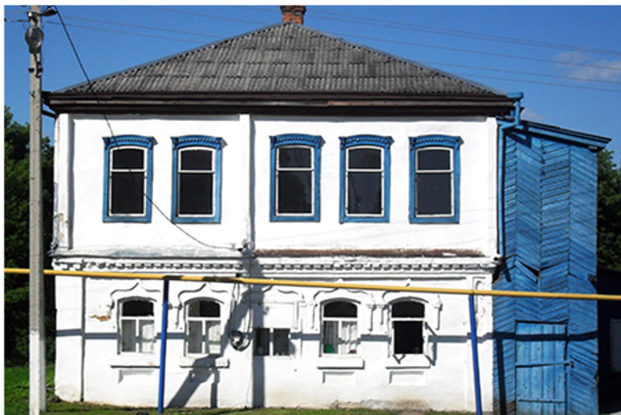
Здание хлебопекарни 1990 год.

В 1941 г. в этом здании размещалась полевая хлебопекарня 297-й стрелковой дивизии 21-й Армии Юго-Западного фронта.