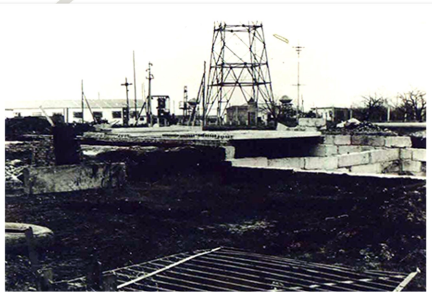
Закладка фундамента на строительство существующей конторы 1978 год.