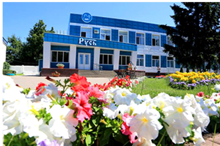
Офисное здание АО «Агрофирма «Русь», 2017 год