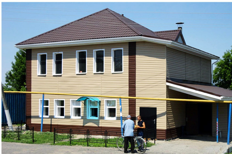
Здание хлебопекарни 2007 год.