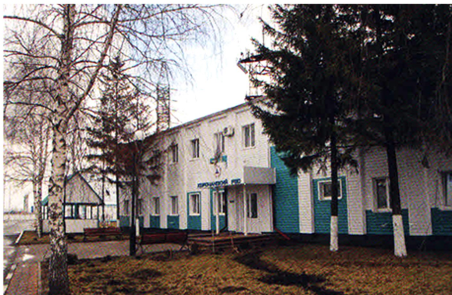
Здание Корочанского РЭС, наши дни