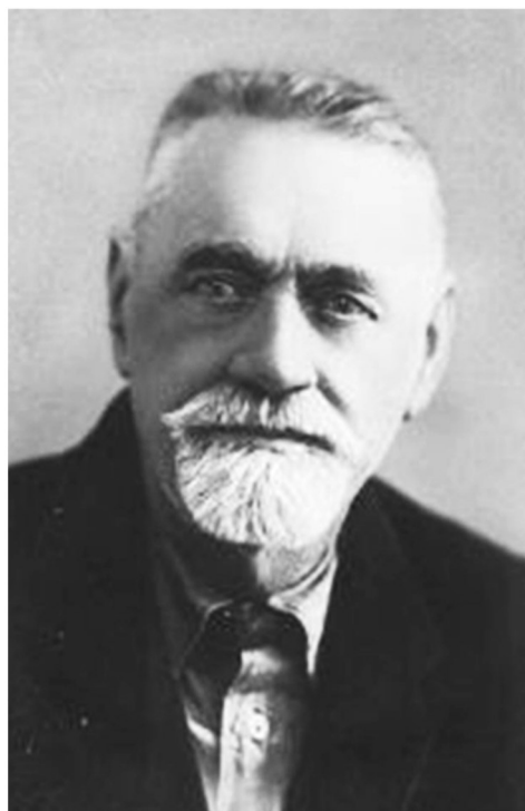
Кичунов Николай Иванович

Ученики находились на полном содержании государства, включая и обмундирование. Кроме специальных предметов преподавались общеобразовательные предметы. Практические занятия по садоводству, цветоводству, огородничеству и пчеловодству велись в саду, огороде, питомниках и пасеках. Школа Корочанских садовых рабочих вначале возглавлялась известным русским учёным садоводом и pomологом Кичуновым Николаем Ивановичем. Ежегодный приём учащихся составлял 21 человек.