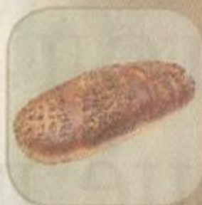
Хлеб «Суворовский» с отрубями Срок хранения – 3 суток. Вес: 400 гр.