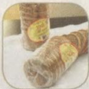
Хлеб «Жито» Срок хранения – 3 суток. Вес: 400 гр.