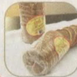
Хлеб «Жито» Срок хранения – 3 суток. Вес: 400 гр.