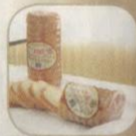
Хлеб «Золотая нива» Срок хранения – 3 суток. Вес: 450 гр.