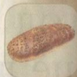
Хлеб «Суворовский» с отрубями Срок хранения – 3 суток. Вес: 400 гр.