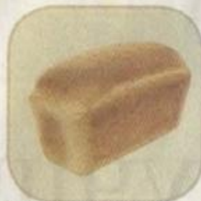
Хлеб «Дарницкий» новый Срок хранения – 3 суток. Вес: 500 гр.