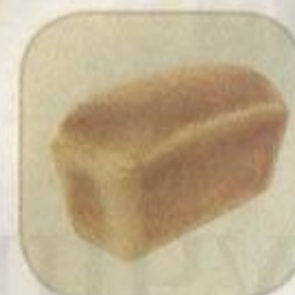
Хлеб «Дарницкий» новый Срок хранения – 3 суток. Вес: 500 гр.