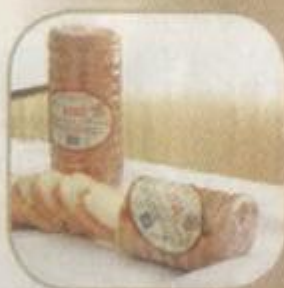
Хлеб «Золотая нива» Срок хранения – 3 суток. Вес: 450 гр.

Продукция соответствует ГОСТу №31807-2012